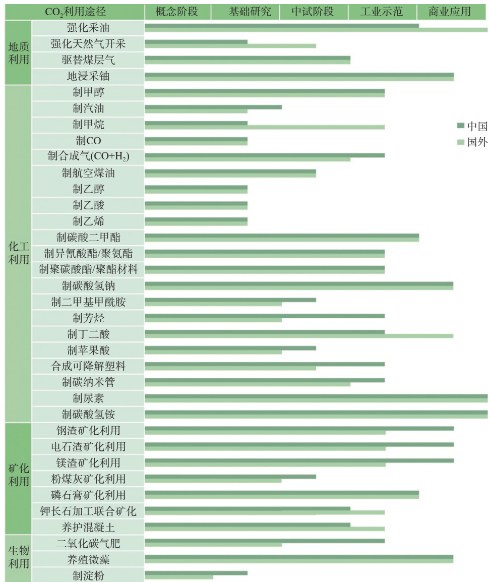
图 1 不同 CO 2 利用技术的发展阶段 [21-22]