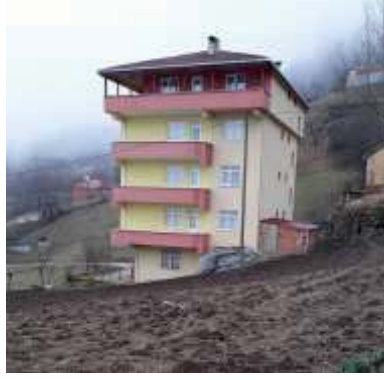
Şekil 4: Hamsiköy yeni konut yapıları