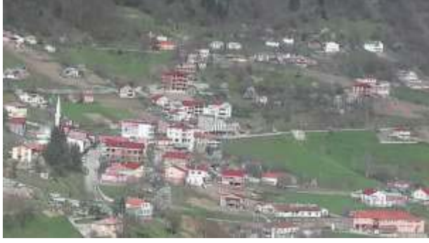
Şekil 6. Hamsiköy merkezi

2017 yılında yapılan bir habere göre Hamsiköy çevre illerden, gerek yurtiçi gerek yurtdışı farklı birçok alanlardan turist çekmektedir. Gelen turistlerin yüzde 75'ini de Arap turistler oluşturmaktadır. Özellikle bölgeye ait lezzetler ve yerleşkenin doğal güzellikleri turistlerin bölgeyi tercih etme sebeplerinin başında gelmektedir (Trabzon, Hamsiköy Sütlaç Turizmi, 2017). 2018 yılının temmuz ayında yapılan habere göre ifade edilenler şu şekildedir: