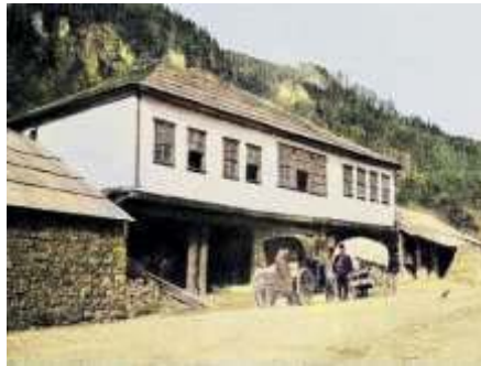
Şekil 3: Hamsiköy eski konak yapısı

Köylerdeki geleneksel konut sisteminde taş ve ahşap kullanılmaktadır. Bu malzemeler, köy iklimine en uygun olan ve köy yaşamındaki ihtiyaçlara en kullanışlı şekilde cevap veren malzemelerdir ve konutlar da bu malzemelerin birlikte kullanılması ile şekillenmektedir (Bal, 2001, s.32). Ahşap, köy ortamında kolay bulunabilen bir malzemedir ve taş bu bölgede yapılarda kullanılmak üzere çıkarmaya uygun şekilde bolca mevcuttur. Değişen köy yaşamına entegre edilen yeni düzene ait sistemler, yapı malzemesinde de görünür şekilde ortaya çıkmaktadır. Yapım sürecini kısaltması ve kısa süreli ekonomik kazanımları sebebi ile yapı malzemesine ait tercihler değişerek betonarme sistem olarak yaygınlaşmaya başlamıştır. Bu yapım sistemine geçiş çok katlı konutlara daha kolay imkân verdiği için geleneksel yapım sisteminin değişmesi ile birlikte köyün dokusundan farklılaşan görsellikte yapılar ortaya çıkmaya başlamıştır. Konut sahipleri geleneksel yapım sisteminin dışında kişisel zevk ve isteklerini; cephe düzeni, cephe renklendirmesi ve cephe hareketliliğine yansıtılmaktadır.