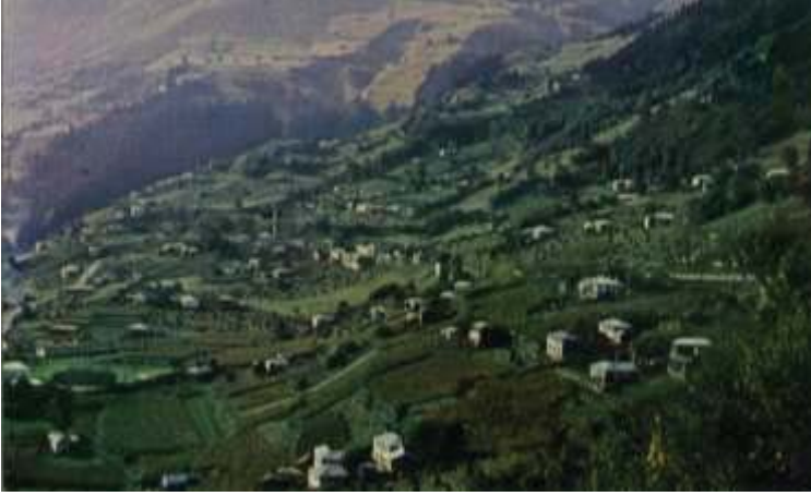
Şekil 7. Hamsiköy eski yerleşim dokusu

Yerleşkeye ait eski ve yeni görüntüler Şekil 7,8,9'da aktarılmıştır. Hamsiköy'ün eski görünümü ile yenisi arasında oldukça büyük farklar mevcuttur. Söz konusu farklardan en dikkat çekenlerinden bir tanesi yollardır. Eski dokuda belirgin olmayan yollar, Hamsiköy'ün yeni halinde oldukça belirgin olup yerleşkeyi şekillendiren bir ağ sistemi olarak gözükmektedir. Yeni konutlara yeni yollar açılması yerleşkedeki ulaşım ağının daha fazla dallanmasına sebep olmaktadır.