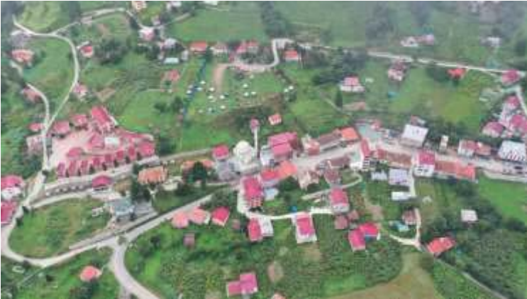
Şekil 8. Günümüzde Hamsiköy