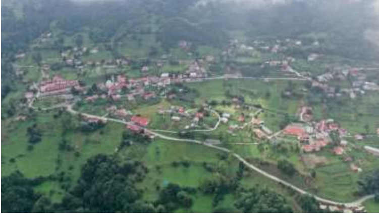
Şekil 9. Günümüzde Hamsiköy

Şahsa ait olan konutların şahsın kişisel isteklerine göre planlanması, yapı dokusunu; yerleşkenin iklimsel ve doğal sirkülasyonuna uygun şekilde tasarlanmış geleneksel yapı plan tipolojisinden ve yapım sisteminden uzaklaştırmaktadır. Turizm sektörü için yapılan yapılar ise konutlara göre yerleşke dokusunun dil birliğinden oldukça ayrılmaktadır.