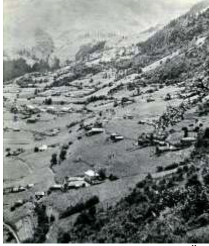
Şekil 1. Hamsiköy eski görünümü (Kaynak: Öztürk, 2018)

Bir yerleşim bölgesinde ekonomik sistemin esas kazanç kaynağının değişmesi ve gelir gruplarının farklılaşması sosyo-kültürel yapıda değişiklikler meydana getirebilmektedir. Bu değişiklikler de mevcuttaki fiziksel ve yapısal çevreyi etkilemektedir. Hamsiköy'ün zengin doğal yapısı ve mutfak lezzetleriyle turizme açık hale gelmesine, geçimini tarımdan sağlayan nüfusun azalmasına ve ilginin turizme yönelmesine bağlı olarak, yerleşkede farklı tip ve düzenlerde yapılaşma artmaktadır. Farklı sosyo-kültürel yapılanmalar, yapılaşma düzeni, yapı malzeme ve teknolojileri ve konut plan tiplerinde farklılıklar oluşturmaktadır. Konutlar geleneksel yapı tipinden uzaklaşmaktadır. Bal (2001)'a göre köyü sürekli kullanan ile geçici olarak kullanan arasında belli başlı farklılıklar vardır. Köyü sürekli kullanan konutunu hayvanlarının yaşam alanı ile birlikte düşünürken geçici yaşayanların konut planlamasında böyle bir kaygısı olmamıştır. Köye dönemsel olarak gelen kullanıcılar inşa ettiği konutları, oturma odaları ve balkonlarını hâkim manzara yönüne göre planlamaktadır. Hayvan barınağı ihtiyacı olmadığından bu mekân planlamaya dahil edilmemektedir. Yeni yapılaşmalar, eskilerin hayvan barınağı olarak kullandığı önü açık olarak arkası eğime oturmuş bodrum kat üzerinde yükselen tek veya çok katlı apartman şeklindedirler. Çok katlı apartmanlar genellikle aile apartmanı niteliğindedir.