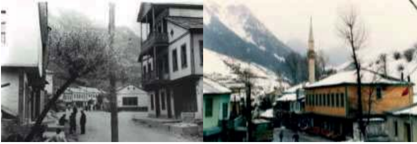
Şekil 2. Hamsiköy eski görünümü

Köylerdeki geleneksel konut sisteminde taş ve ahşap kullanılmaktadır. Bu malzemeler, köy iklimine en uygun olan ve köy yaşamındaki ihtiyaçlara en kullanışlı şekilde cevap veren malzemelerdir ve konutlar da bu malzemelerin birlikte kullanılması ile şekillenmektedir (Bal, 2001, s.32). Ahşap, köy ortamında kolay bulunabilen bir malzemedir ve taş bu bölgede yapılarda kullanılmak üzere çıkarmaya uygun şekilde bolca mevcuttur. Değişen köy yaşamına entegre edilen yeni düzene ait sistemler, yapı malzemesinde de görünür şekilde ortaya çıkmaktadır. Yapım sürecini kısaltması ve kısa süreli ekonomik kazanımları sebebi ile yapı malzemesine ait tercihler değişerek betonarme sistem olarak yaygınlaşmaya başlamıştır. Bu yapım sistemine geçiş çok katlı konutlara daha kolay imkân verdiği için geleneksel yapım sisteminin değişmesi ile birlikte köyün dokusundan farklılaşan görsellikte yapılar ortaya çıkmaya başlamıştır. Konut sahipleri geleneksel yapım sisteminin dışında kişisel zevk ve isteklerini; cephe düzeni, cephe renklendirmesi ve cephe hareketliliğine yansıtılmaktadır.