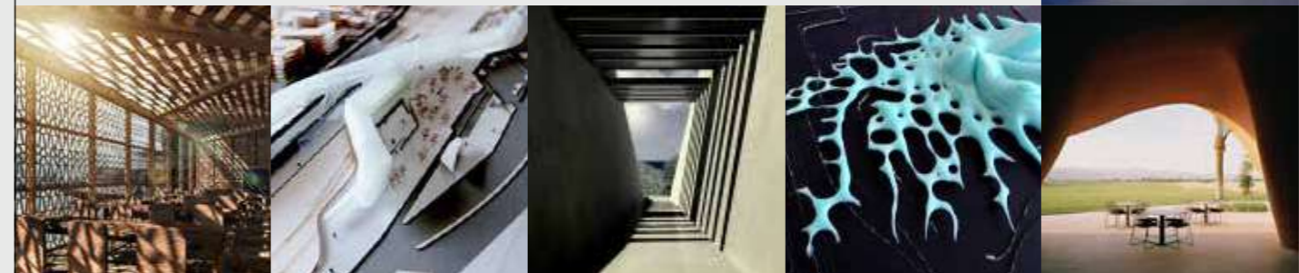
Cover image Athens Conservatoire (detail) by Ioannis Despotopoulos

Το ένθετο του περιοδικού στην αγγλική θα ολοκληρωθεί σύντομα. The English version of the review will be coming soon.