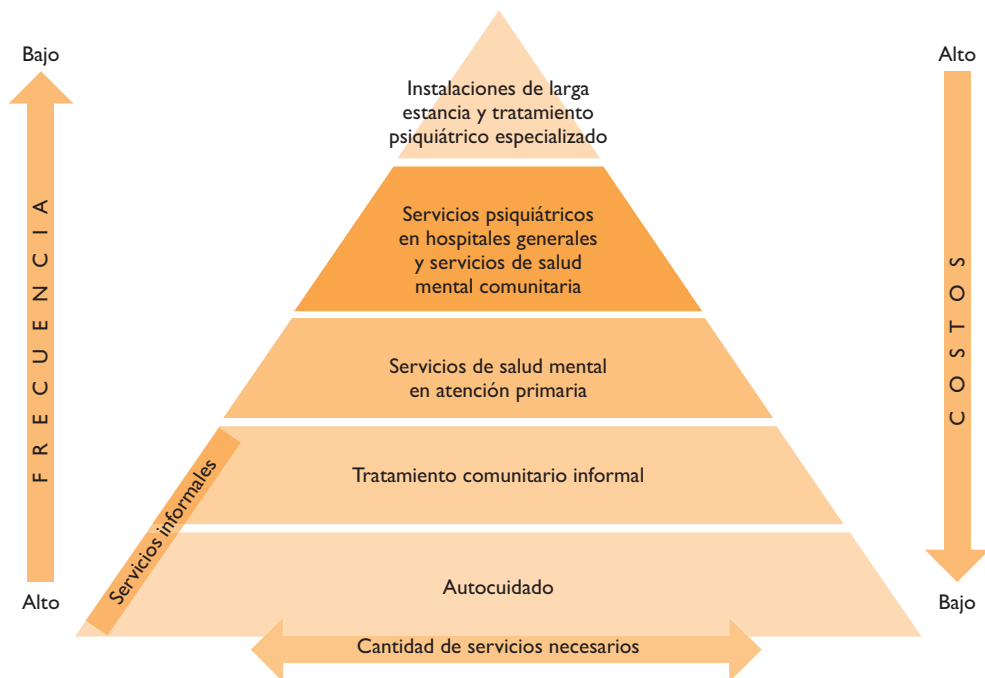
FIGURA 1. PIRÁMIDE ORGANIZACIONAL DE SERVICIOS PARA UN FUNCIONAMIENTO ÓPTIMO DE ATENCIÓN A LA SALUD MENTAL. OMS, 2013

menor necesitará servicios de mayor intensidad, y una fracción aún menor de quienes son diagnosticados con algún problema de salud mental necesitarán tratamiento psiquiátrico especializado. Por ello, tanto el tamizaje como el monitoreo de usuarios resultan esenciales, ya que permiten la identificación de los individuos con diferentes vulnerabilidades y su adecuada referencia a servicios competentes. 12 Asimismo, se recomienda que profesionales locales sean los principales actores en el proceso, y que expertos y agencias internacionales se involucren brindando apoyo técnico para solucionar problemas y fortalecer la capacidad local. 15