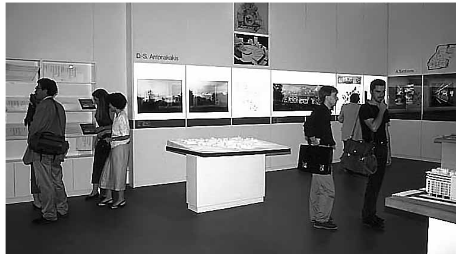
Άποψη της έκθεσης «Νέα δημόσια κτήρια» στην 5η Biennale Αρχιτεκτονικής