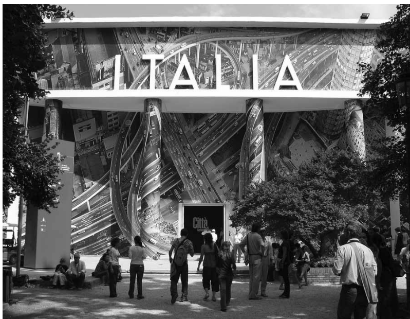
Το περίπτερο της Ιταλίας στη 10η Biennale Αρχιτεκτονικής